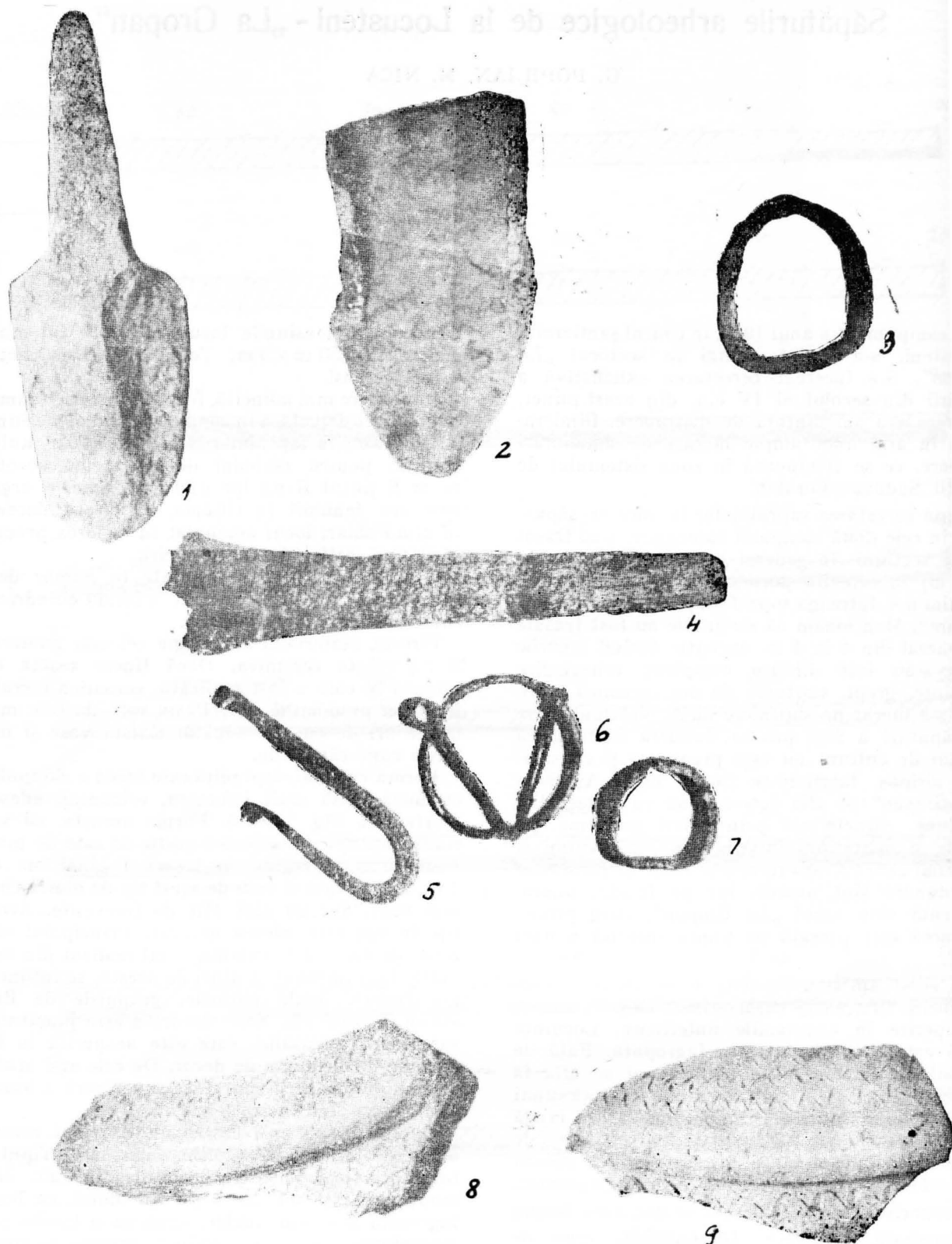
Fig. 1. Locusteni— „La Gropan”. 1—2 brăzdare de plug din fier; 3 manșon din fier; 4—7 diferite obiecte din fier; 8—9 fragmente din vase ceramice mari.

ceramicii este daco-romană și că acestea nu reprezintă altceva decât o etapă în dezvoltarea ceramicii din epoca romană anterioară.